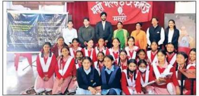
कैरियर काउंसलिंग में भाग लेती छात्राएं।